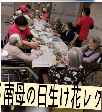
3南母の日生け花レク