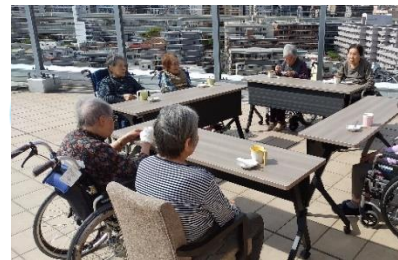
1階西北鯉のぼりクレープレク